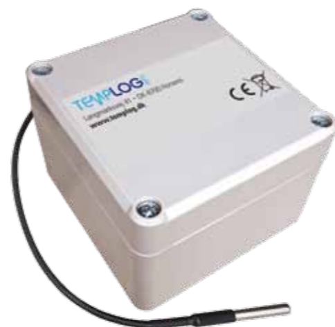
TEMPLOG maxi anvendes primært til køle-/fryserum med tykke vægge, hvor fra der ikke er mobildækning