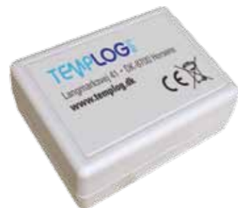
TEMPLOG mini anvendes alle steder, hvor der er mobildækning (TDC, Telia, Telenor).